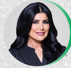
أسرار جوهر حياة أمين السر