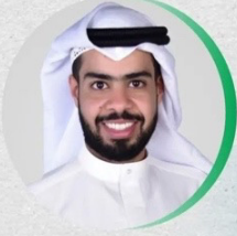
شارك د. خالد صالح الرشيدى مفوض العلاقات الدولية

متحدثاً في ندوة "مهنة المحاماة - مبادئ بنغالور للسلوك القضائي" و التي عقدت ضمن ندوات ملتقى الكويت القانوني و الذي تقيمه كلية القانون الكويتية العالمية تحت رعاية معالي وزير العدل خلال يومي ٢٩-٣٠ مارس ٢٠٢٢ في مقر الكلية .